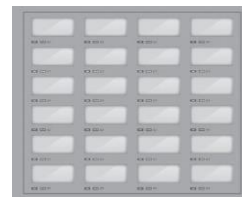
24 BOXŮ 5,60 V x 12,60 Š