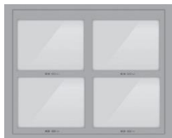
4 BOXY 24 V x 27,40 Š