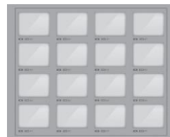
16 BOXŮ 10,20 V x 12,60 Š