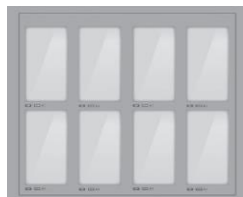
8 BOXŮ 24 V x 12,60 Š