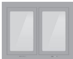
2 BOXY 52 V x 27,40 Š

Rozměry jsou rozměry otvorů jednotlivých boxů